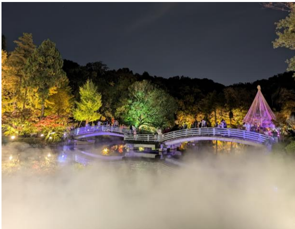
日頃紫色にライトアップしているたいこ橋が 一夜限り青色になります

町田薬師池公園四季彩の杜は、町田GIONスタジアムにも近く、日頃よりサポーターの方に試合前後に立ち寄ってもらうための取り組みを行ってきました。薬師池に隣接した野津田薬師堂では、スタジアム～野津田公園上の原広場～幸山華厳院の坂～神奈中野津田車庫～七国山～福王寺薬師堂と続く道を「幸福街道」と提唱しています。当日は、サポーターの皆様が試合後にこの道を通ってぜひ薬師池まで足をのぼしていただき、町田市を代表する紅葉スポットをお楽しみいただけたらと考えております。事前の周知へのご協力をどうぞよろしくお願いいたします。